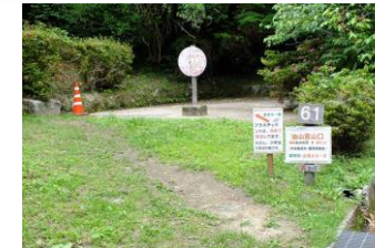
②61番Aコース、中央展望台へ