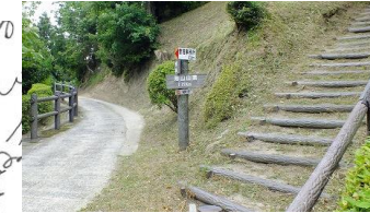
④72番Aコーススタート