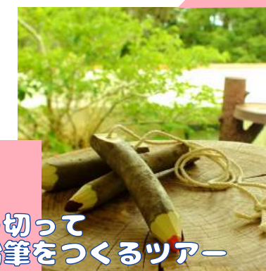
木を切って色鉛筆をつくるツアー

8月9~11日は油山でもりもり遊びましょう！ 詳細は裏面の[行事案内]をご覧ください。 ★...要予約