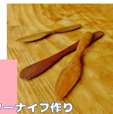
★ パターナイフ作り