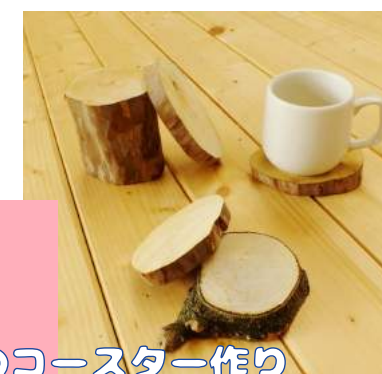
木のコースター作り