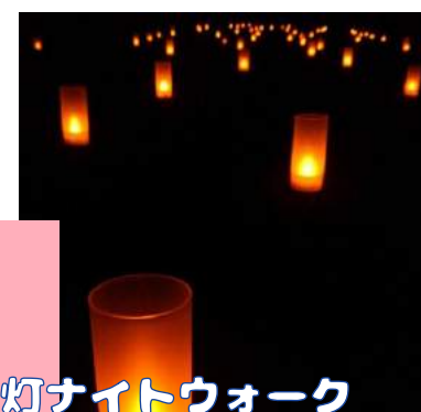
★ 山の灯ナイトウォーク