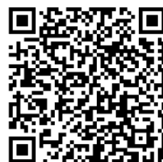
ホームページ QR コード