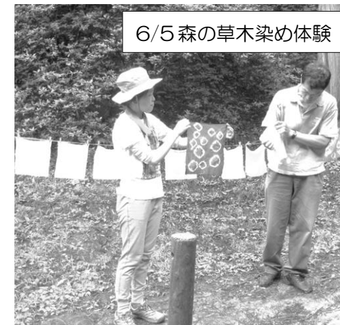
6/5 森の草木染め体験

雨の心配もなく、過ごしやすい夜でした。カブトムシの森へ行き、樹液が出ている様子や、ライトトラップに集まってきた昆虫を観察しました。いつもはもっと遅い時間にやって来るクワガタやカブトムシが行事中にトラップへやって来てくれて、子ども達はとても嬉しそうでした。