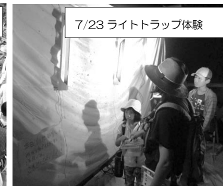
7/23 ライトトラップ体験