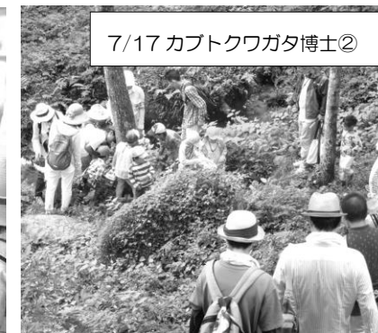
7/17 カブトクワガタ博士②