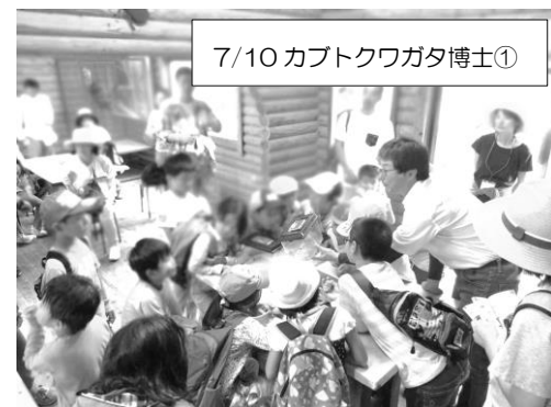
7/10 カブトクワガタ博士①