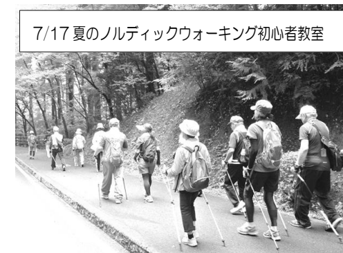
7/17 夏のノルディックウォーキング初心者教室