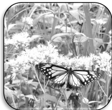
長距離の「渡り」をするチョウ・アサギマダラが吸蜜に好んで立ち寄るのがヒョドリバナ。