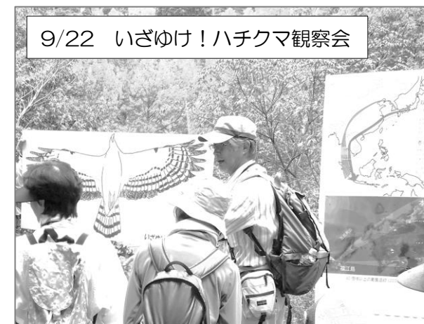
9/22 いざゆけ!ハチクマ観察会