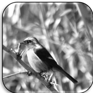
「冬鳥」として油山へやって来るジョウビタキ。オレンジのお腹に黒い紋付袴のような羽が特徴。