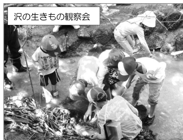
沢の生きもの観察会

例年より残暑が厳しい初秋となりましたが31名の参加がありました。水の森を歩いたことにより、汗はかきましたが風や沢の水に涼を感じることができました。他の回のハイキングよりは冒険的なコースでしたが誰もリタイアすることなく楽しんで歩いていただいたようでした。