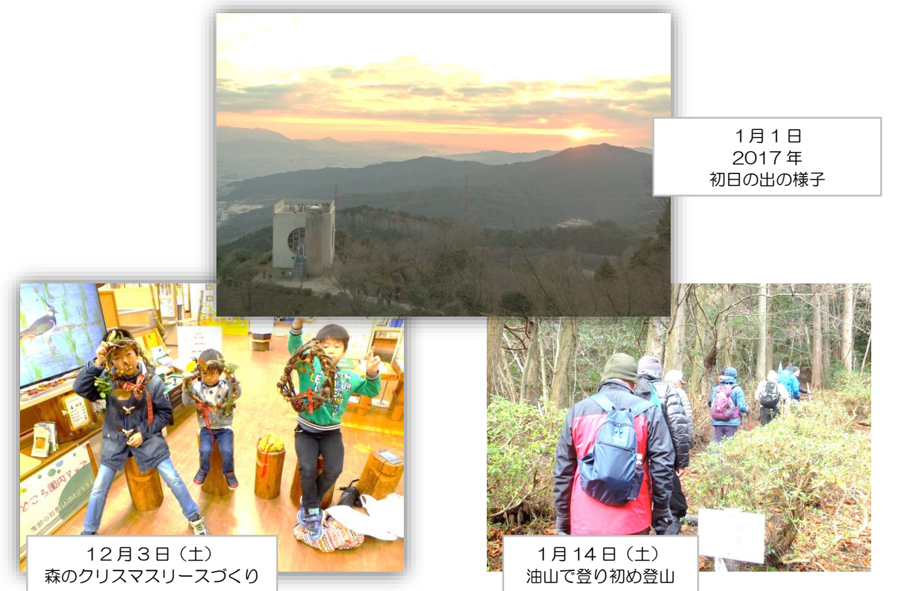
1月1日 2017年 初日の出の様子

1月1日(元日) 初日の出 曇の間から、今年の市民の森では、多くの方々がご来光を拝められました。来年も良い天気でありますよう!