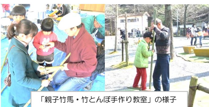
「親子竹馬・竹とんぼ手作り教室」の様子