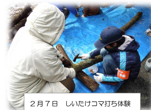
2月7日 しいたけコマ打ち体験

3月13日(日) 早春の油山自然かんさつハイキング 散る間際のウメ・出始めたフキノトウ・ニホンアカガエルの卵とおたまじゃくし・ちょうど見ごろのツクシショウジョウバカマなどを観察しながら寒の戻りで肌寒い森を散策しました。初めて見たものがあったり、春の息吹を感じられたりして、楽しく穏やかな時間を過ごせたとの感想が多かったです。