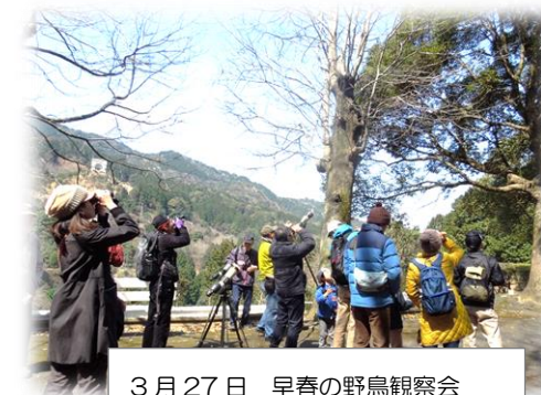
3月27日 早春の野鳥観察会