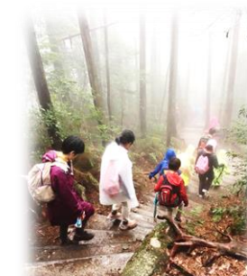
3月19日 ファミリー登山