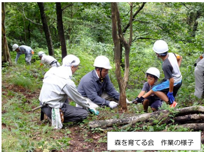
森を育てる会 作業の様子