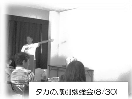
タカの識別勉強会(8/30)