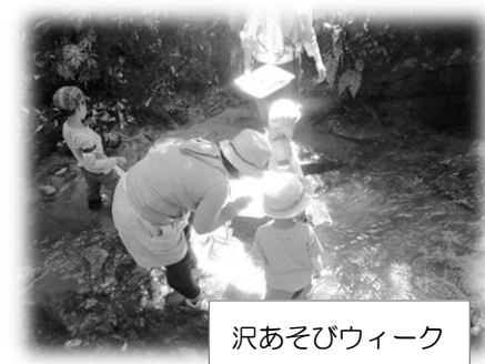
沢あそびウィーク