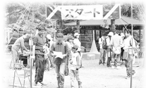
◆昨年秋の大会の様子

☆油山の自然に親しみ、親子のふれあいを楽しんでいただくことを目的とし、親子を基本に、2名以上で1チームとします。 ☆競技形式とし、体力に応じ、2～3コースを設定。タイムを競い、各コース上位3チームを表彰します。