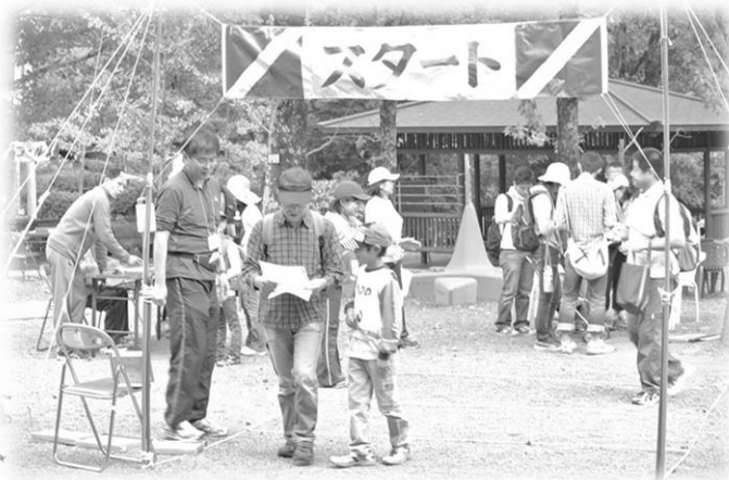
◆昨年秋の大会の様子

た~くさん歩いた後に森の中で食べるお昼ご飯は格別に美味しいですよ! ぜひご参加ください!