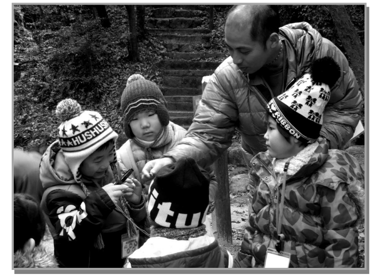
おたからドングリ見せて~!