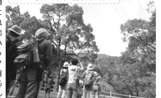
タカの渡りと自然観察会の様子

お彼岸の季節、福岡市上空を渡っていく「ハチクマ」。名前のとおり、ハチが大好物のタカのなかまです。東北地方などで夏場に繁殖を終えたハチクマは、この時期一斉に越冬地である東南アジアへと渡っていきます。今回はこのハチクマを見たかったのですが、見れるかどうかはタカ次第。期待と不安を募らせながらクスの広場で出発前のレクチャーをしていると...「出た~!」山頂方面に数羽のハチクマが上昇気流に乗って旋回しています。最高のスタートを切った観察会、その後もエゴノキの実を食べにくるヤマガラや、クマノミズキに群がるメジロ、その中にはカワラヒワもちらほら。中央展望台ではすいぶん近い距離でゆっくり旋回するトビの姿を観察することができ、全部で16種類の野鳥を参加者の皆さまと楽しみました。