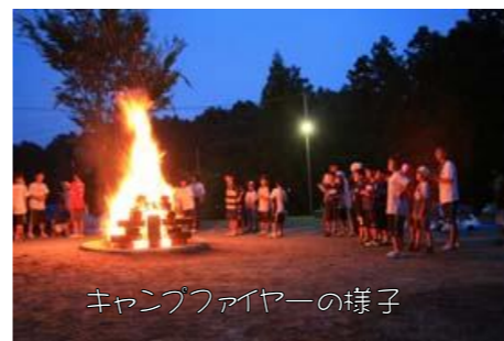
キャンプファイヤーの様子