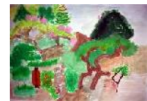
銀賞 竹尾 萌